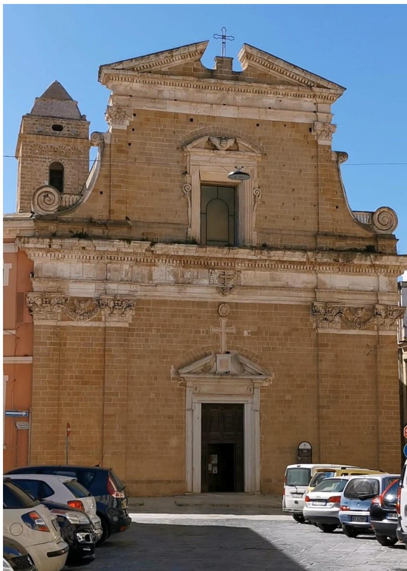
Brindisi. Santa Maria degli Angeli.