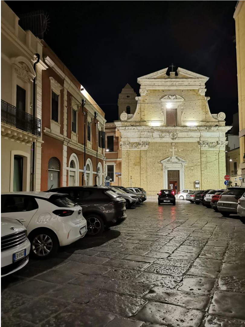
Brindisi. Santa Maria degli Angeli (ph. Enzo Claps).