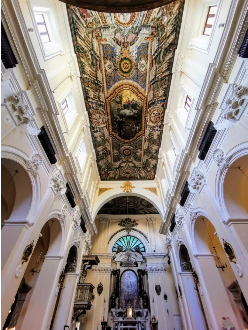
Brindisi. Santa Maria degli Angeli. Interno.

Venti pezzi e venti fulgori grana cinquantasei.