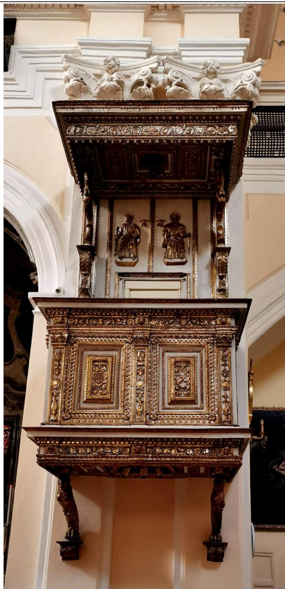
Brindisi. Santa Maria degli Angeli. Pulpito.