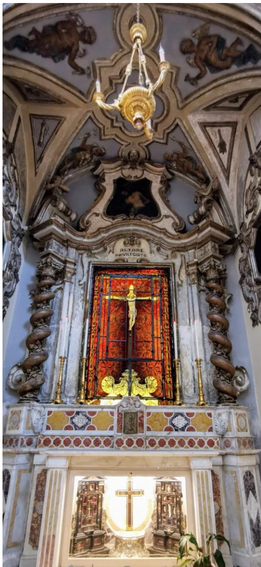
Brindisi. Santa Maria degli Angeli. Altare del Crocefisso.