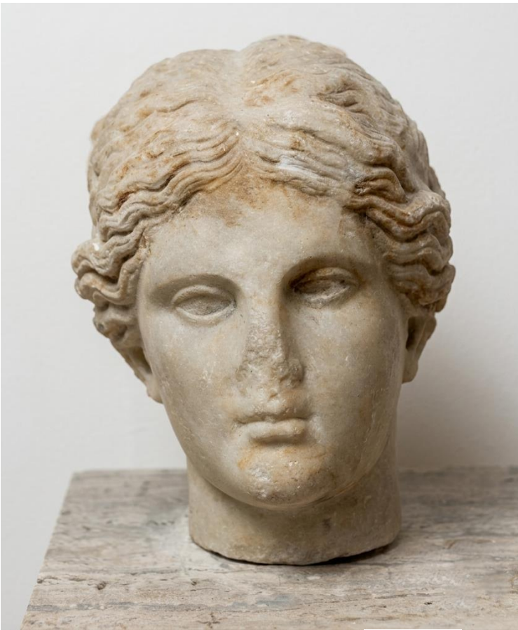
Brindisi. Museo archeologico Francesco Ribezzo. Testa femminile (Artemide/Diana?). Età Adrianaea.