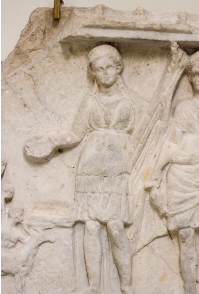
Brindisi. Museo archeologico Francesco Ribezzo. Rilievo votivo tardo ellenistico. Particolare. Artemide sacrificante.