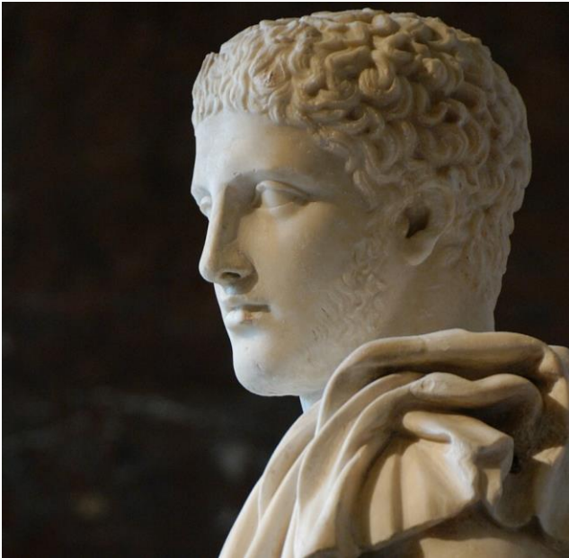
Diomede ruba il Palladio. Marmo, copia romana del II-III secolo d.C. da un originale greco del V secolo a.C. Parigi, Louvre.

controllo identitario dei Messapi. Gli dei vecchi che il mondo ignora non sono dunque sprofondatai nel tempo a Brindisi; vi sono rimasti murati, trasformando il mito del nostos greco nel sigillo eterno della resistenza e dell'identità del suolo messapico.