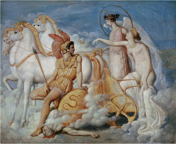
Jean Auguste Dominique Ingres – Venere, ferita da Diomede, ritorna sull'Olimpo (Kunstmuseum Basel, Svizzera)

Trogo descrive i conflitti e i patti territoriali tra Diomede, i Dauni e le popolazioni limitrofe. Brindisi viene evocata in questo orizzonte culturale ed egemonico come la città che, in epoca arcaica, controllava e difendeva il territorio circostante dalle pressioni esterne, come l'espansione dei Tarantini, inserendosi nello stesso ciclo di leggende che vedevano Diomede dominare l'area centro-settentrionale della Puglia.