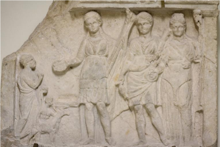
Brindisi. Museo archeologico Francesco Ribezzo. Rilievo votivo tardo ellenistico. Artemide sacrificante.

è l'accenno all'origine etolica di Diomede (v. 623). A questa tradizione fa riscontro la saga che racconta la fuga di Diomede da Argo in Etolia, da cui sarebbe venuto a fondare Brindisi.