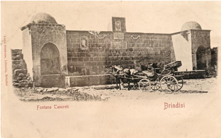
Brindisi. Fonte Grande o di Tancredi. Brindisi: Simeone Lisco Libreria, 1900.

le diomedee, sulle isole Tremiti è letta nell'economia del mito come una fuga disperata e una transizione verso una dimensione puramente naturale, sancendo il definitivo fallimento del progetto insediativo etolico in terra brindisina.