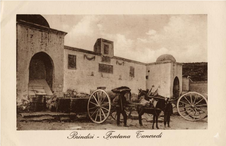
Brindisi. Fonte Grande o di Tancredi. Brindisi: Angela Anelli, 1912.

Il mito si relaziona alla circostanza che, tra il VI e il V secolo a.C., la Puglia meridionale fu teatro di conflitti tra colonie greche e comunità locali, evidenziando la resistenza messapica alla penetrazione greca