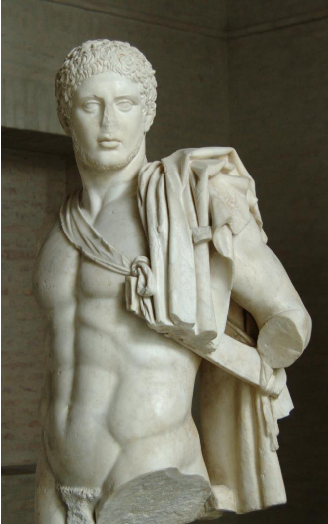
Diomede. Copia romana da un originale Greco ca. 440-430 a.C., attribuito a Kresilas. Monaco di Baviera. Glyptothek.