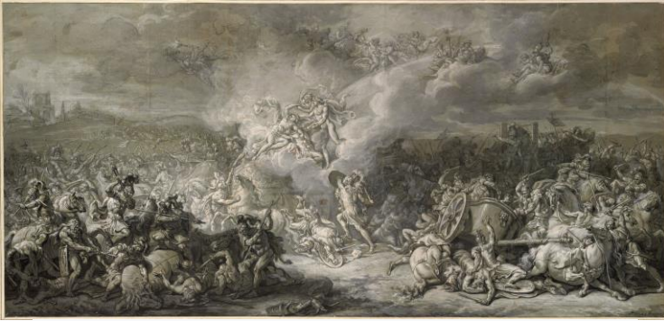
Jacques-Louis David. La battaglia di Diomede. 1776. Vienna, Albertina.

riflettendo le differenze politiche locali. Diventa ora un elemento perturbatore e aggressivo: non è più il fondatore che edifica, ma il condottiero che assedia o che interviene militarmente in guerre confinarie.