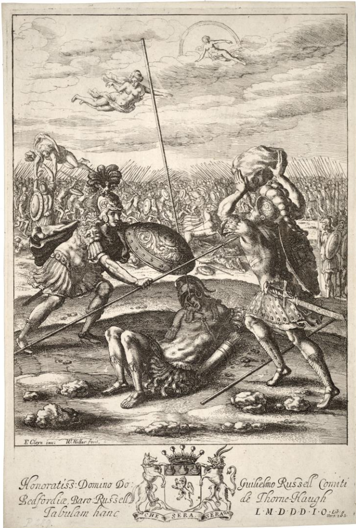
Wenceslas Hollar (1607-1677). Enea e Diomede.