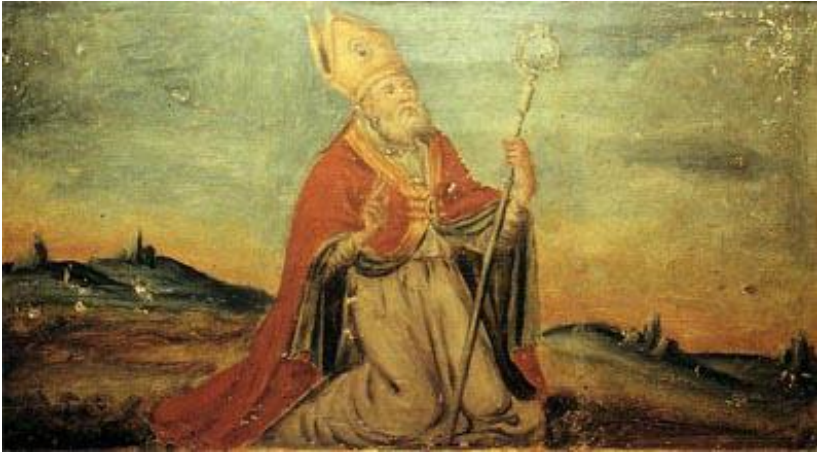
Brindisi. Basilica Cattedrale. Urna delle ballotte del Capitolo. San Leucio.

L'indicazione nella Vita di Otranto quale primo approdo salentino del santo riflette uno stato di fatto proprio dei secoli compresi fra il VI e l'XI allorché quel porto, sotto controllo bizantino, era il principale nel Salento e quella sede vescovile, elevata ad arcivescovile e metropolitana, fu grandemente favorita da Costantinopoli.