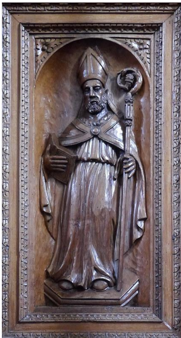
Brindisi. Basilica Cattedrale. Coro dei Canonici. San Leucio