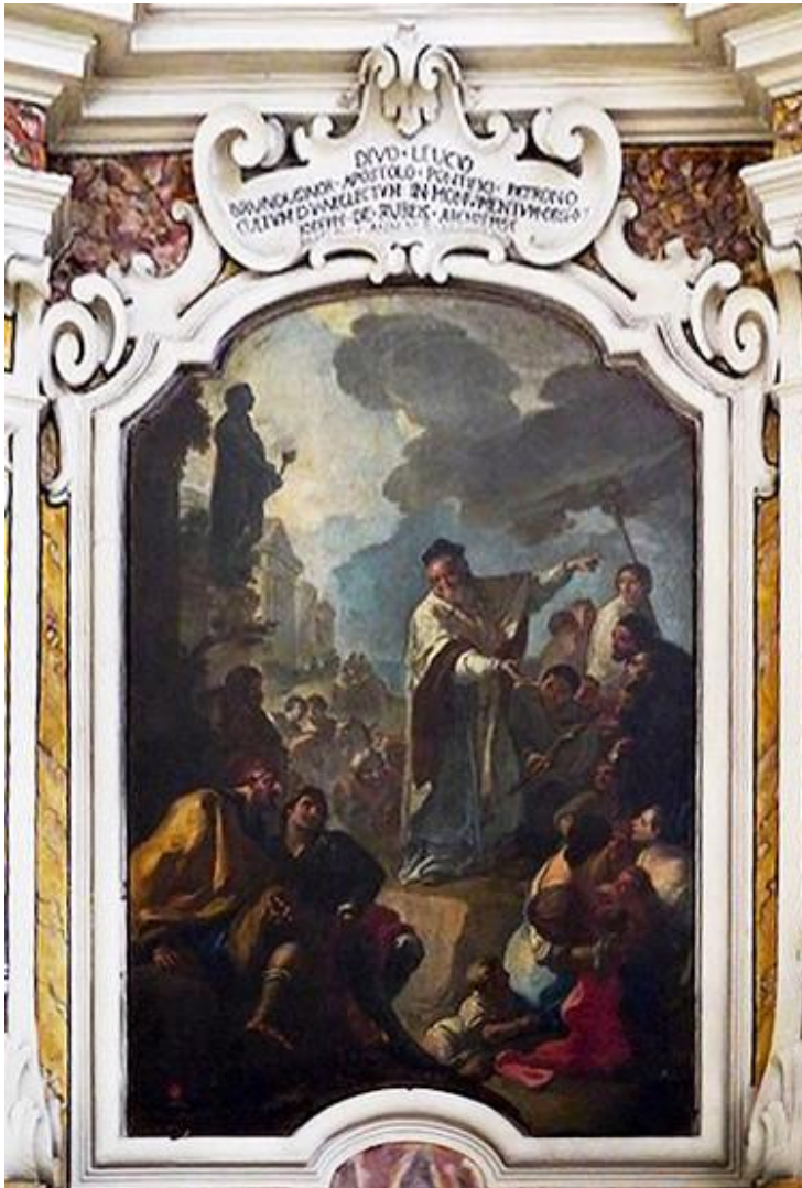
Brindisi. Basilica Cattedrale. Oronzo Tiso. La predicazione di san Leucio