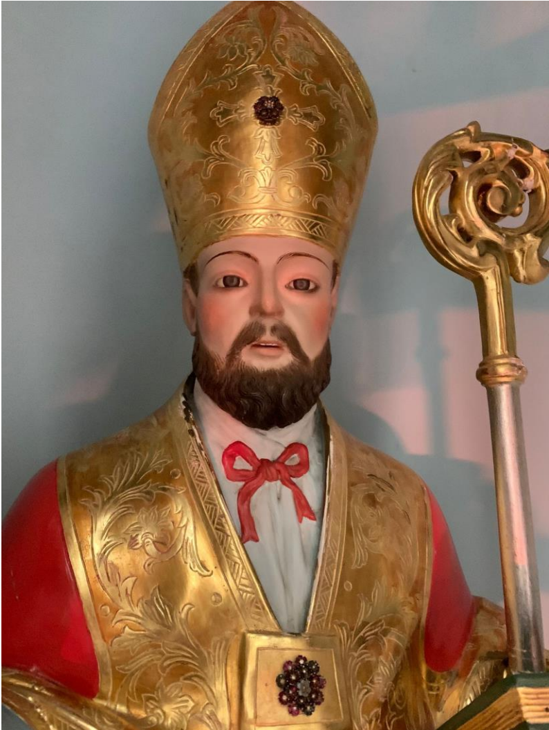
San Leucio del Sannio. Parrocchiale San Leucio. San Leucio