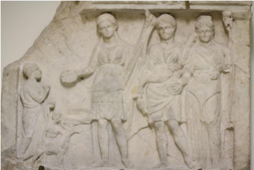
Brindisi. Museo archeologico "Ribezzo". Sacrificio a Diana. Bassorilievo.

«Una cerva è tenuta avanti all'ara dal vittimario mezzo ignudo, ed appresso di esso vedesi il sacerdote colle mani giunte, e cogli occhi elevati in atto di orare. Quindi dall'altra parte dell'ara osservasi una donna con veste succinta, che nella destra tiene una patera, nella sinistra una fiaccola, viene appresso un uomo, che ha nelle mani un urceolo, ed una clava, al di cui lato altra donna si vede, elegantemente ornata, con patera ed altro urceolo» 10 .